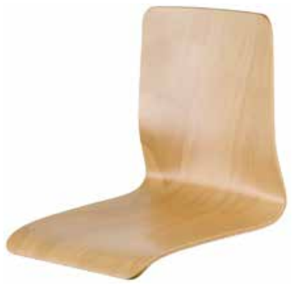
Schale 1001 63