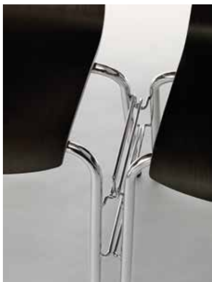
Stapelsteg / Reihenverbinder