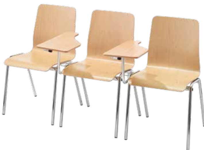
Mit Schreibtislar als Extra