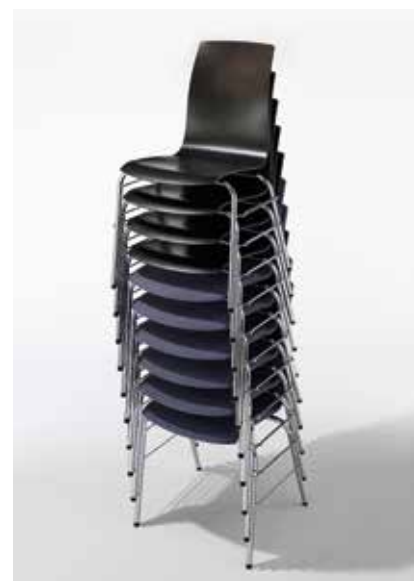
Stapelung ohne Armlehne