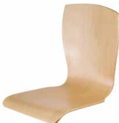
Schale 1029 63