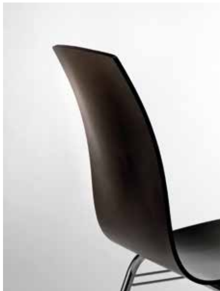
Ergonomisch geformte Rückenlehne