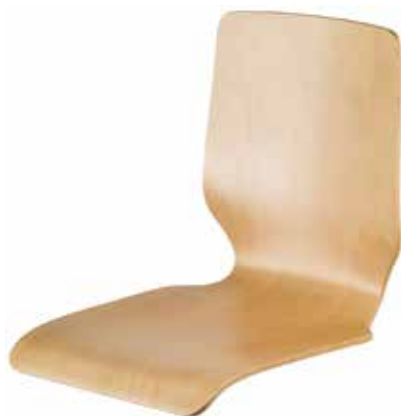
Schale 1002 63