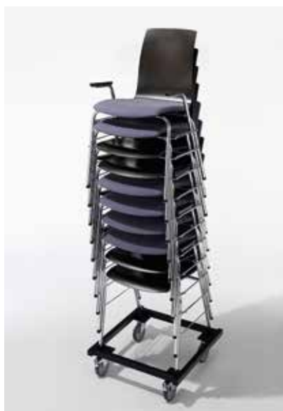
Stapelung mit Armlehne