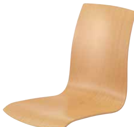
Komfortschale 1047 63