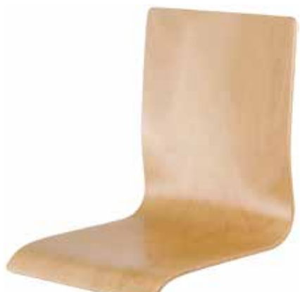
Schale 1045 63