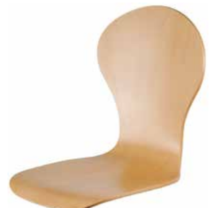
Schale 1028 63