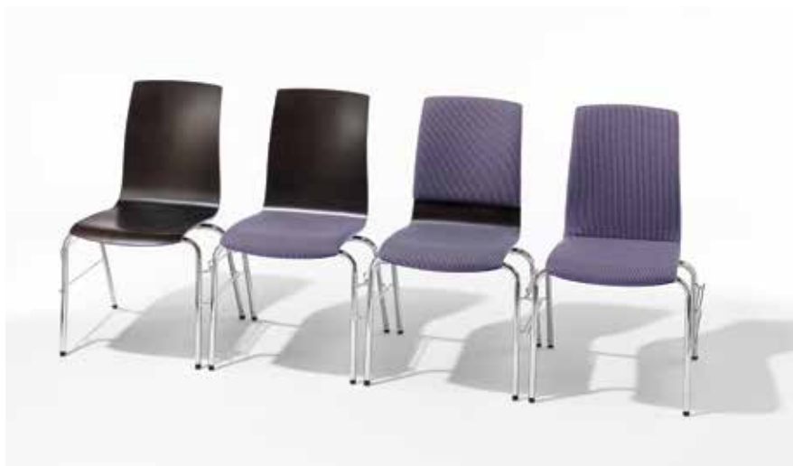
Verschiedene Modelle mit Reihenverbindung